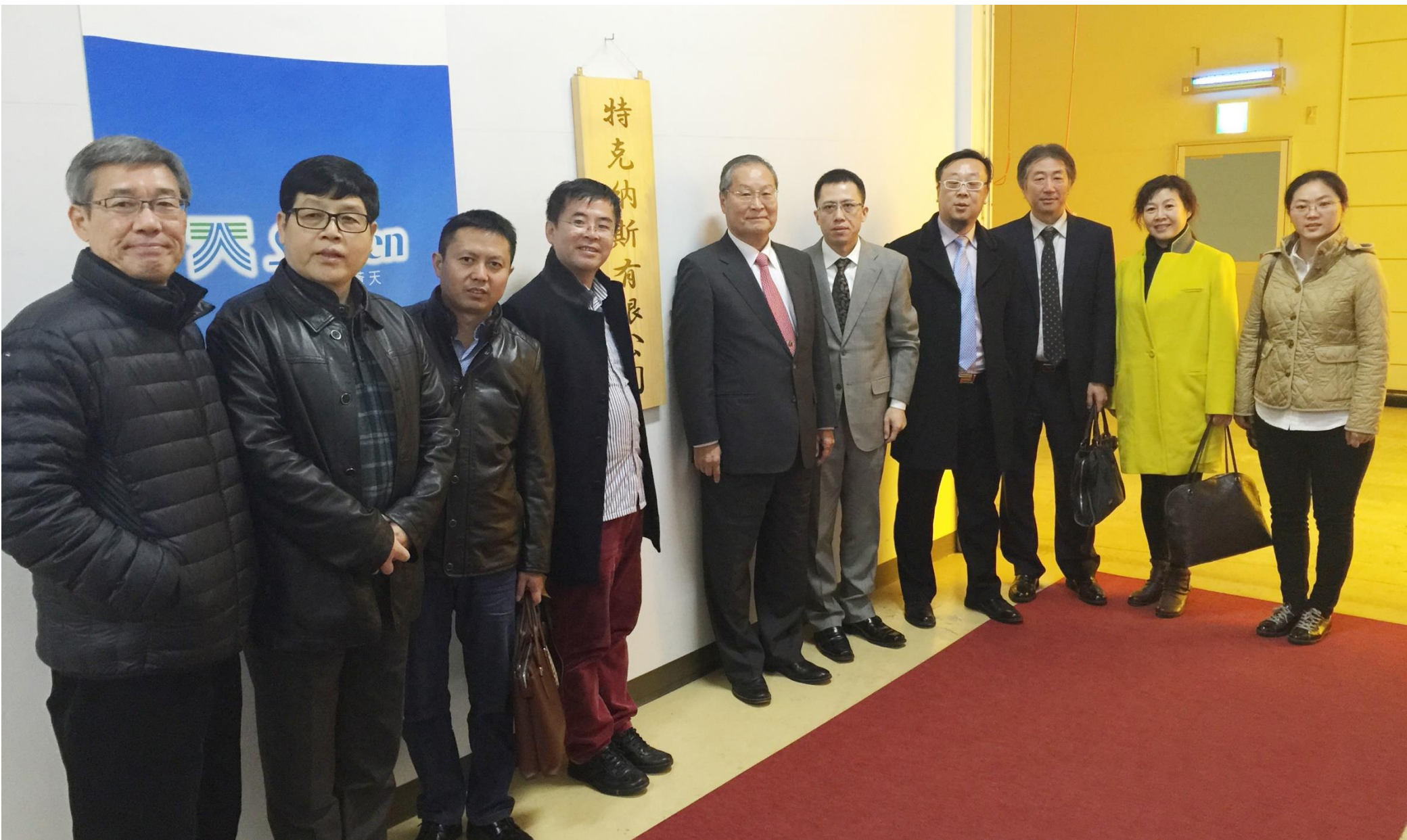
2015年12月8日 中国水设备访问团在山梨县的『秘水』制造厂合影