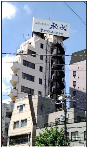
特克纳斯有限公司 总部大楼