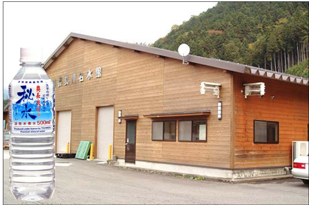
岐阜县的『秘水』制造工厂